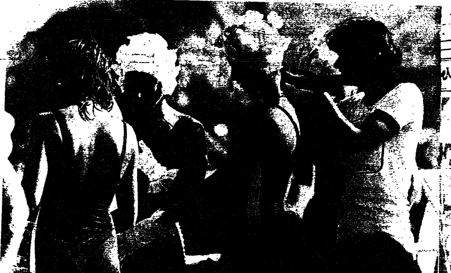
لقطة للشركات ، قبل تولون الى الماء